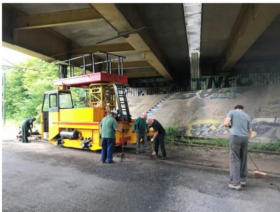
Werken aan het tramspoor langs de Deûle

Het is duidelijk dat dit deel van het traject door de Franse toeristische dienst nog onder handen moet genomen worden. De bewegwijzering wordt zeldzamer en men is volop bezig om het spoor van het toeristische trammetje langs de Deûle terug berijdbaar te krijgen. Dit tramspoor loopt langs / over het jaagpad wat voor snelle fietsers soms tot gevaarlijke toestanden kan leiden. Oppassen geblazen dus.