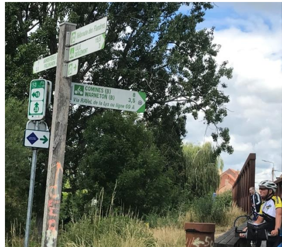
Wegwijzers in Deulémont

Vanuit Wambrechies gaat het verder langs de Deûle. Intussen zijn de wegwijzers volledig afwezig maar je dient gewoon het jaagpad te volgen tot in Deulémont waar de rivier in de Leie uitmondt.