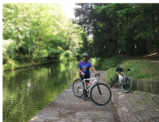
Poseren langs het Canal de Roubaix

Het Canal de Roubaix loodt ons verkeersvrij door de drukke Noordfranse industriesteden Roubaix en Tourcoing. Wie wil, kan via het groene Canal de Tourcoing een zijsprong maken tot in het centrum van Tourcoing.