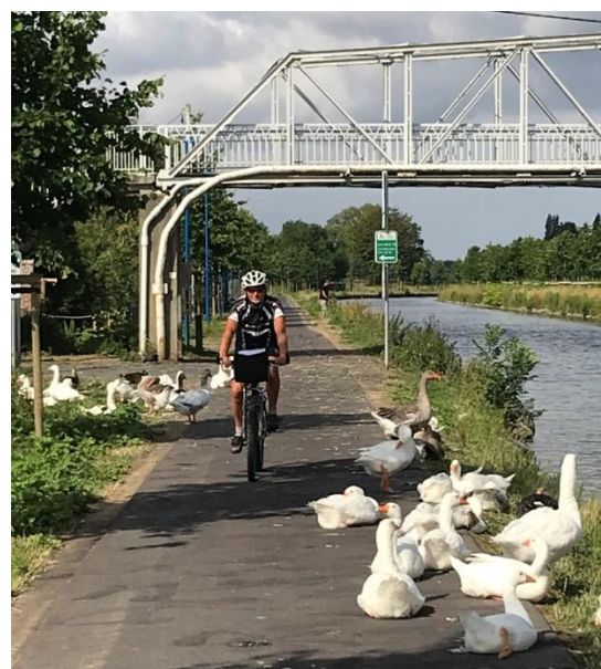
Fietsen langs het Canal de l’Espierres

Roubaix. Alleen aan de Franse nummerplaten op de auto’s en het feit dat de jaagpaden onverhard worden, merken we dat we Frankrijk zijn binnengefietsd. Onderweg komen we regelmatig infoborden tegen waardoor we ons perfect kunnen oriënteren. Ook de bewegwijzering is voorlopig nog feilloos.